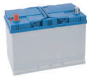
BATTERIA AUTO 12 V